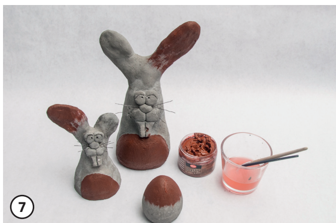
7 Roesteffect volgens de productbeschrijving met een penseel opbrengen.