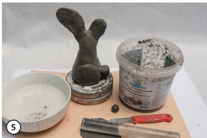
5 Buik, tangen, snuit, ogen apart maken. De handschoenen met water vochtig maken, dan gaat het modelleren makkelijker. De gemodelleerde delen op het basisfiguur plakken, evt. een beetje water gebruiken.