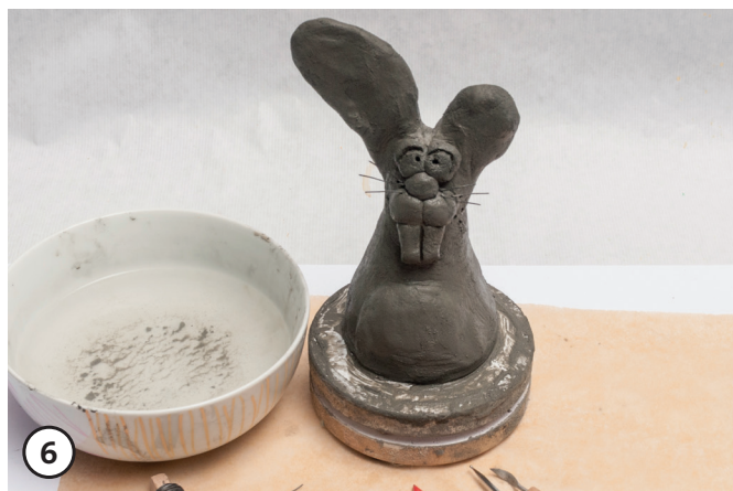
6 Een stuk van het wikkeldraad afknippen. De draden als snorharen door de gemodelleerde snuit steken. Het figuur (op het bakpapier) ca. 1 - 3 dagen laten drogen.