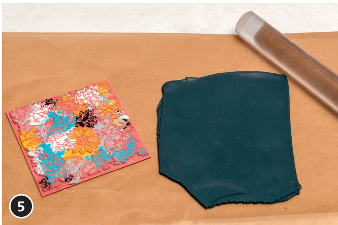
5 Eine ca. 2 – 3 mm starke Platte aus schwarzem Fimo mit dem Modellier-Roller (oder der Knetmaschine) ausrollen. Plattengröße sollte der Größe des Buchstabens entsprechen.