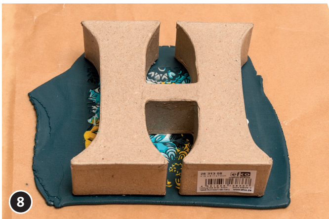
8 Buchstaben auf die dekorierte Modelliermasse auflegen. Mit dem Bastelmesser die Form des Buchstabens ausschneiden.