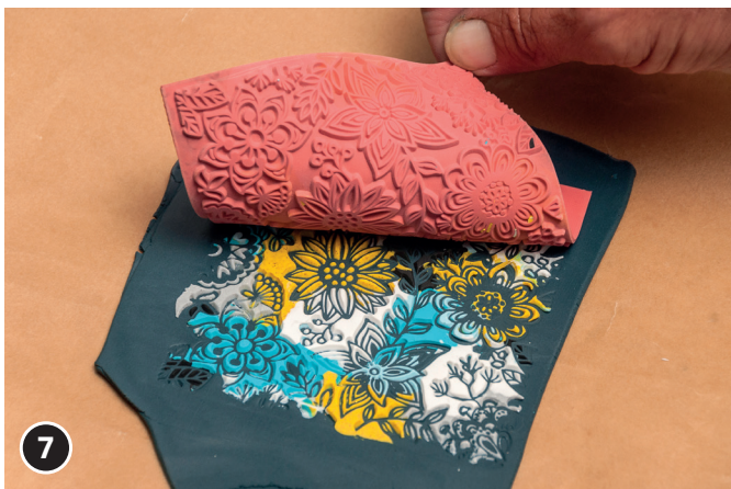
7 Vorsichtig die Texturmatte abnehmen.