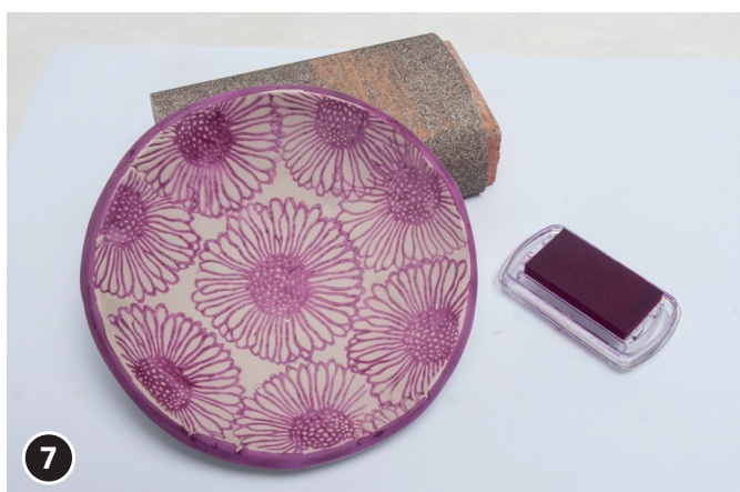
7 Indien gewenst, met het stempelkussen de rand van de schaal kleuren. Nogmaals met de föhn drogen.

Let op! Deze schalen zijn ter decoratie, niet om van te eten.