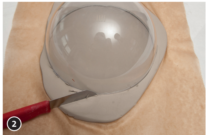
Een helft van de gewenste kunststof bol op de kleiplaat leggen. Langs de bol, met een puntig mes, een ronde schijf uitsnijden.