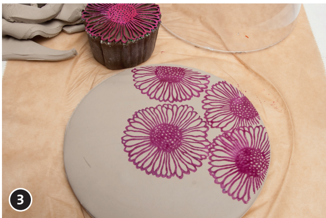
De houten stempel op het stempelkussen drukken. De houten stempel op de klei schijf stempelen.