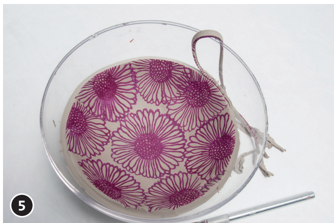
5 Schijf laten drogen in een gipsvorm of grote kunststof halve bol.