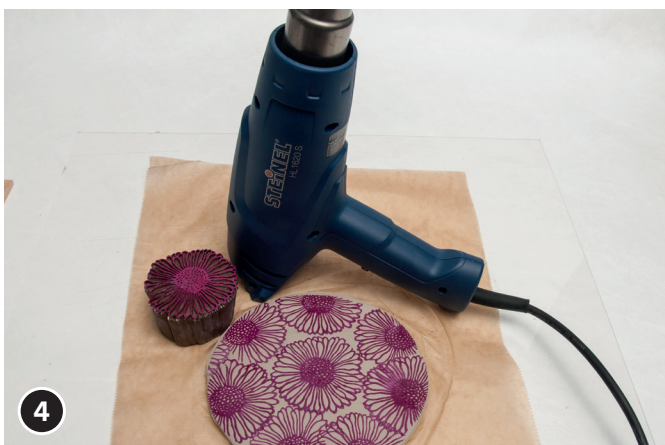
De verf met een föhn drogen.