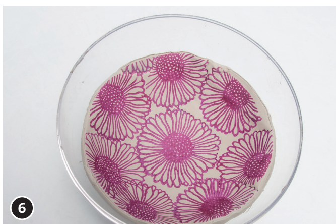
6 Schaal ca. 1 - 2 dagen in de vorm laten drogen. Droogtijd hangt af van de grote van het werkstuk. Na het drogen de schaal uit de vorm halen. Het restvocht laten drogen.