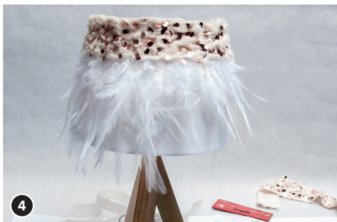
4 Colocar la cinta decorativa sobre los puntos adhesivos y presionar.

¡El equipo creativo de OPITEC desea que se divierta mucho!