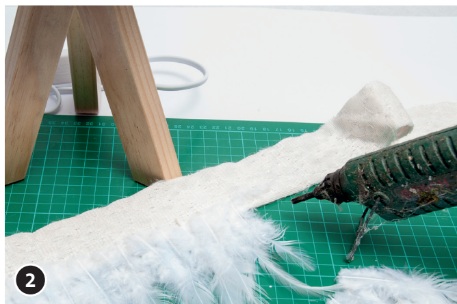
2 Fijar las plumas en el interior de la parte inferior de la pantalla con la pistola termoencoladora.