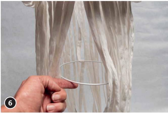
6 Colocar la anilla de \varnothing 150 mm en la posición deseada y pasar una tira de Zpagetti desde fuera hacia dentro, alrededor de la anilla.