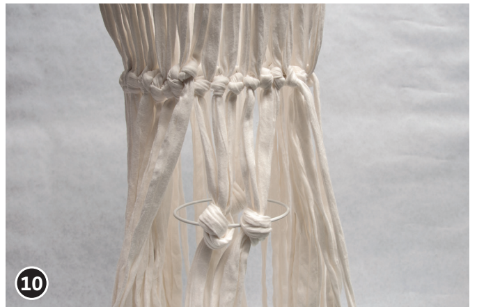
10 Hacer un nudo en cada cinta a la distancia deseada. Colocar la última anilla, de \varnothing 100 mm, a la misma distancia que la segunda de la primera. Rodearla con todos los hilos y anudarlos todos.