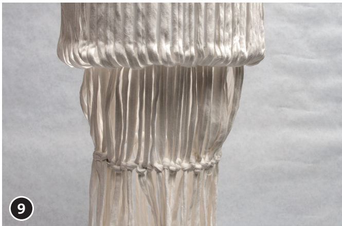
9 Seguir el mismo procedimiento con todos los hilos.