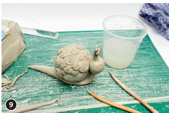
9 De bol voor de kop, voelsprietten en ogen vormen en op de bol drukken. De neus en mond inkepingen maken met een modelleer stokje. Wanneer de slak klaar is deze ca. 1-2 dagen goed laten drogen.