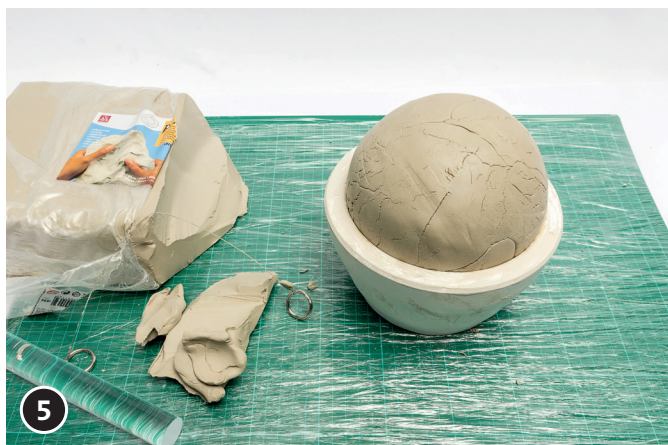
5 Zo is een holle klei bol gevormd. De bol een nacht laten drogen. De volgende dag de bol verder bewerken.