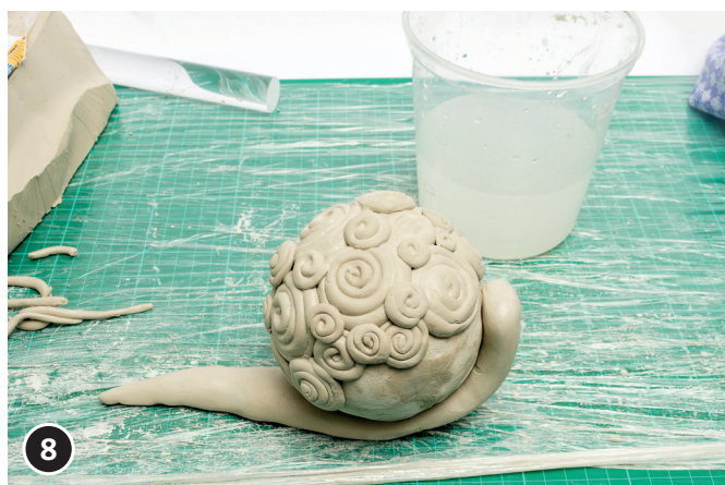
8 Het lichaam van de slak modelleren. De bol op het lichaam plakken en wederom de plek vooraf bevochtigen met water en de bol aan de onderkant.