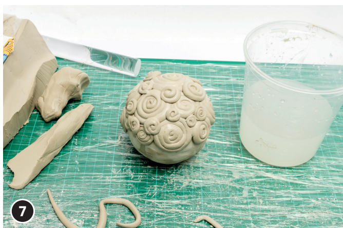
7 De bovenste helft van de klei bol met spiralen bedekken.