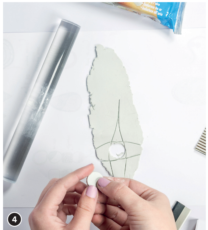
4 Die Scheibe herausnehmen und mit den Händen abrunden.