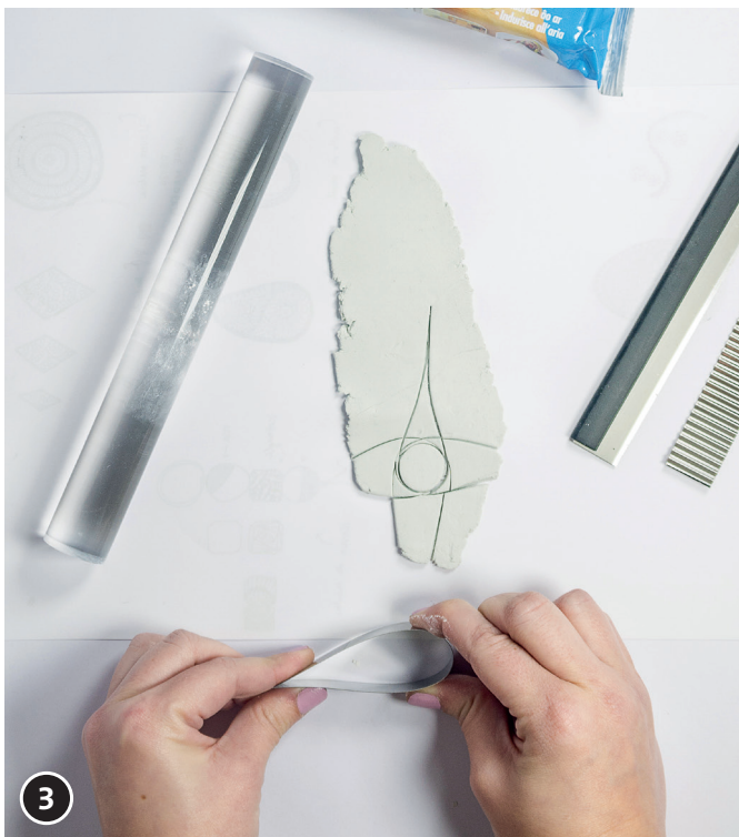
3 Ein möglichst biegsames Werkzeug wählen, es biegen und so in den Ton drücken, dass eine Kreisform entsteht.