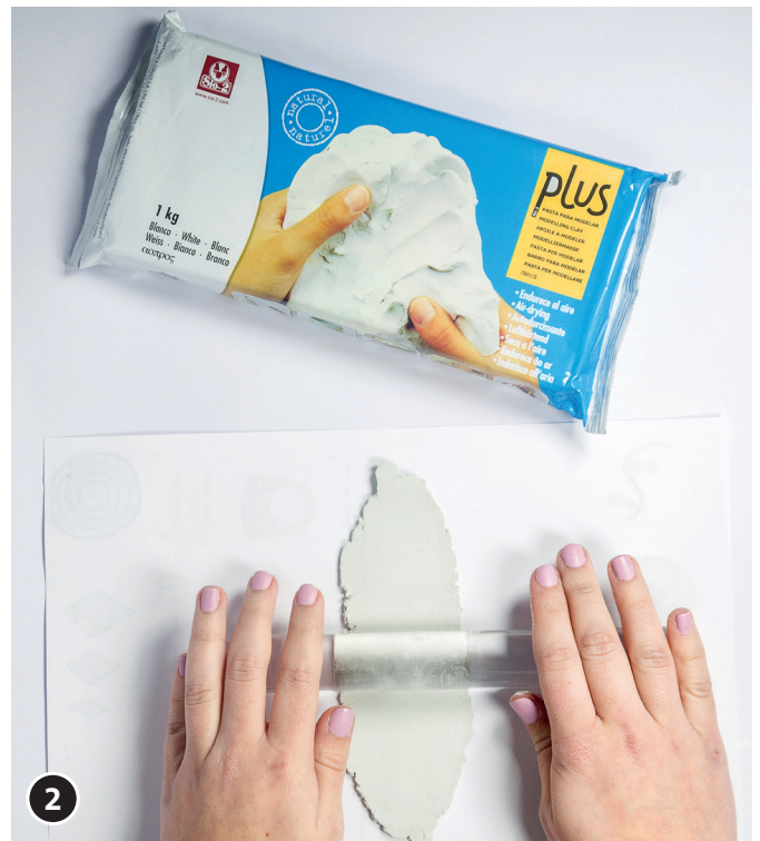
2 Mit dem Modellierroller ausrollen, bis der Ton ganz flach ist.