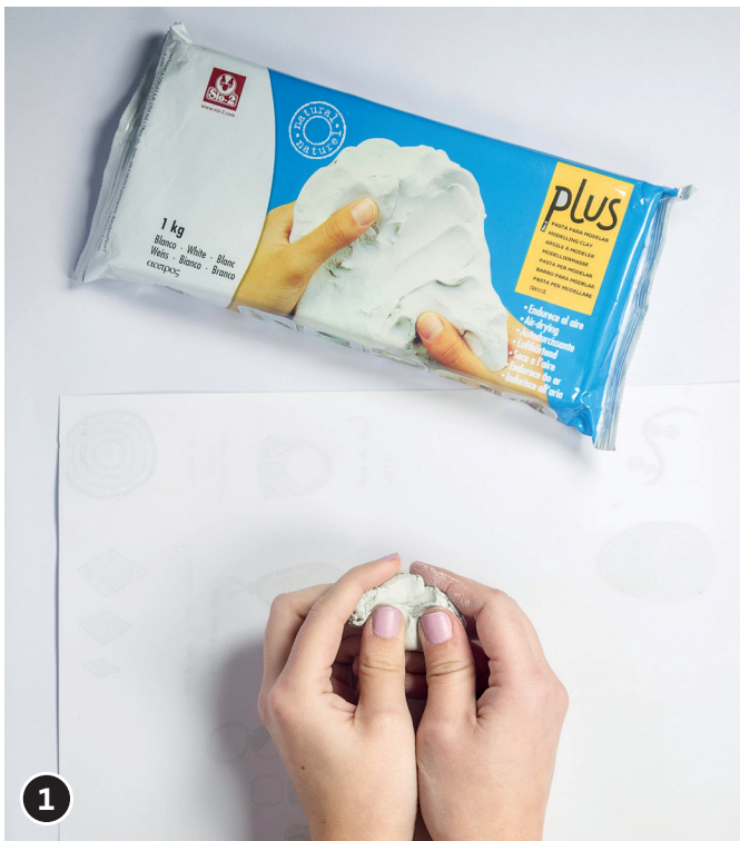
1 Den Ton gut kneten, damit er schön formbar wird.